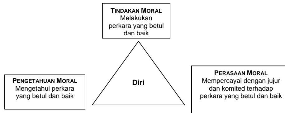
Rajah 1: Hubungan antara pengetahuan moral, perasaan moral dan tindakan moral

konsisten. Implikasinya, murid perlu disediakan dengan peluang yang banyak dan pelbagai bagi mengamalkan nilai murni. Kemahiran yang relevan untuk tindakan moral termasuk